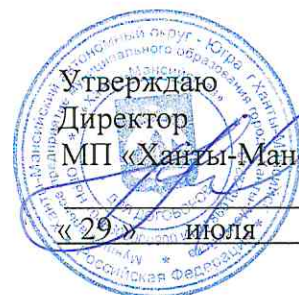
График производства работ по техническому обслуживанию внутридомового газового оборудования многоквартирного жилого дома МП «Водоканал»